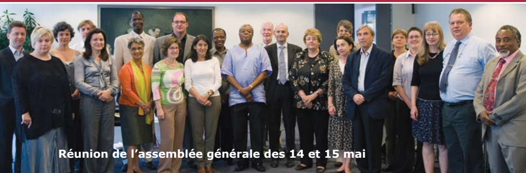
Réunion de l'assemblée générale des 14 et 15 mai