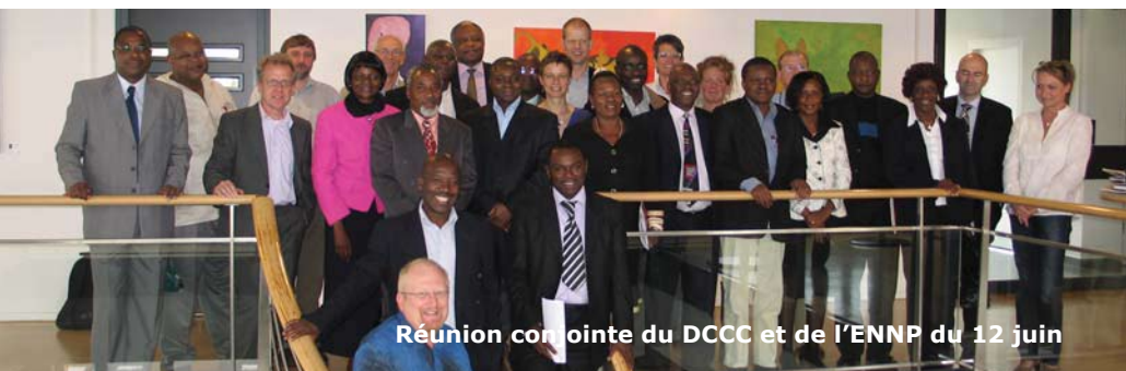
Réunion conjointe du DCCC et de l'ENNP du 12 juin

Un autre point important de la réunion a été la décision d'organiser un cinquième Forum de l'EDCTP à Arusha en Tanzanie en octobre 2009. Les membres de l'assemblée générale ont également été invités à rejoindre l'équipe de l'EDCTP lors des visites de sites afin de développer la sensibilisation entre les États Membres et les partenaires africains.