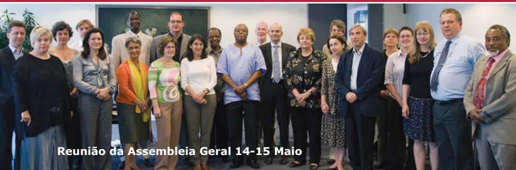
Reunião da Assembleia Geral 14-15 Maio