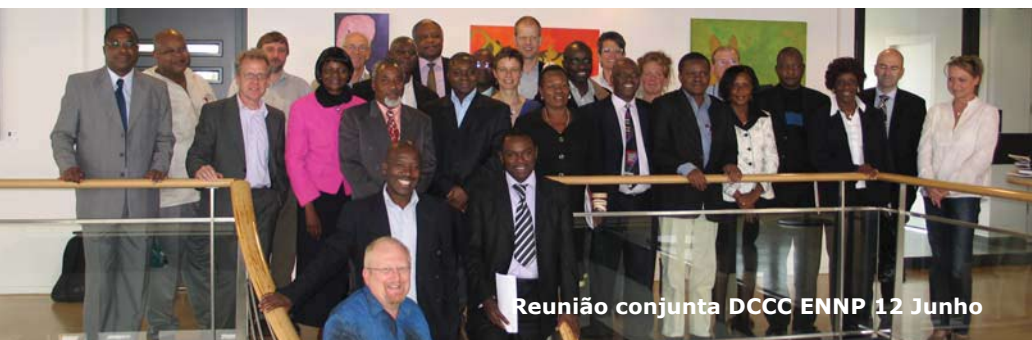
Reunião conjunta DCCC ENNP 12 Junho

Outro destaque da reunião foi a decisão de realizar um Quinto Fórum da EDCTP em Arusha, na Tanzânia, em Outubro de 2009. Os membros da AG foram convidados a juntar-se à equipa da EDCTP nas suas visitas aos locais para desenvolver o apoio entre os Estados-membros e os parceiros africanos.