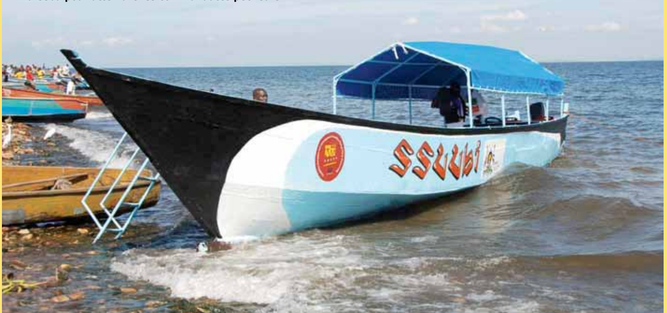
Bateau utilisé dans le projet conduit par le Prof Pontiano Kaleebu pour atteindre les communautés pêcheurs

Consulter également la vidéo récente de l'EDCTP présentant certains projets consacrés au VIH, sur la chaîne YouTube de l'EDCTP ( www.youtube.com/edctpmedia ).