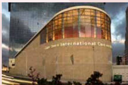
Le Cape Town International Convention Centre, lieu de la Conférence de haut niveau sur l'EDCTP-II

Le département Sciences & technologies d'Afrique du Sud, la Commission européenne et l'EDCTP organisent conjointement la conférence à l'occasion du 15e anniversaire de la signature de l'accord de coopération scientifique et technologique entre l'Union européenne et l'Afrique du Sud. Seront également organisées des visites de sites et d'institutions d'essais cliniques qui bénéficient de financements de l'EDCTP, dans la région du Cap.