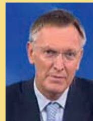
Dr. Janez Potočnik, Comissário Europeu para a Ciência e Investigação

O Comissário Europeu para a Ciência e Investigação, Dr. Janez Potočnik, discursou na cerimónia de abertura através de uma mensagem de vídeo. O Comissário Europeu falou sobre o progresso da coordenação da investigação através da EDCTP ao longo dos anos e, referindo-se à avaliação independente do programa da EDCTP que decorreu em 2006, comenta: "Como sempre acreditei no nobre propósito desta iniciativa, decidi continuar... Agora, quase três anos depois, está a apresentar os seus resultados."