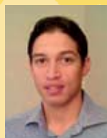
Dr. Dominique Pepper, vencedor do Prémio Cientista Africano Excepcional Júnior da EDCTP

Pode ler o artigo completo no blogue do Fórum: www.edctp.org/forumblog