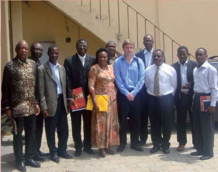
A delegação da EDCTP reúne-se com membros da Comissão Ética Nacional do Benim

De 25 a 29 de Maio de 2009, a EDCTP realizou uma visita local ao Benim. As visitas locais são meios importantes de representação, recolha de dados e avaliação técnica de locais envolvidos nos projectos financiados pela EDCTP. A EDCTP teve reuniões com os cientistas e a administração da Faculdade de Ciências da Saúde na Universidade Abomey Calavi, em Cotonou, coordenadores de projecto, e as suas equipas, bem como com ministros do governo local e outras entidades políticas. O Ministério da Saúde e a Universidade de Abomey Calavi estão envolvidos nos seguintes projectos apoiados pela EDCTP: