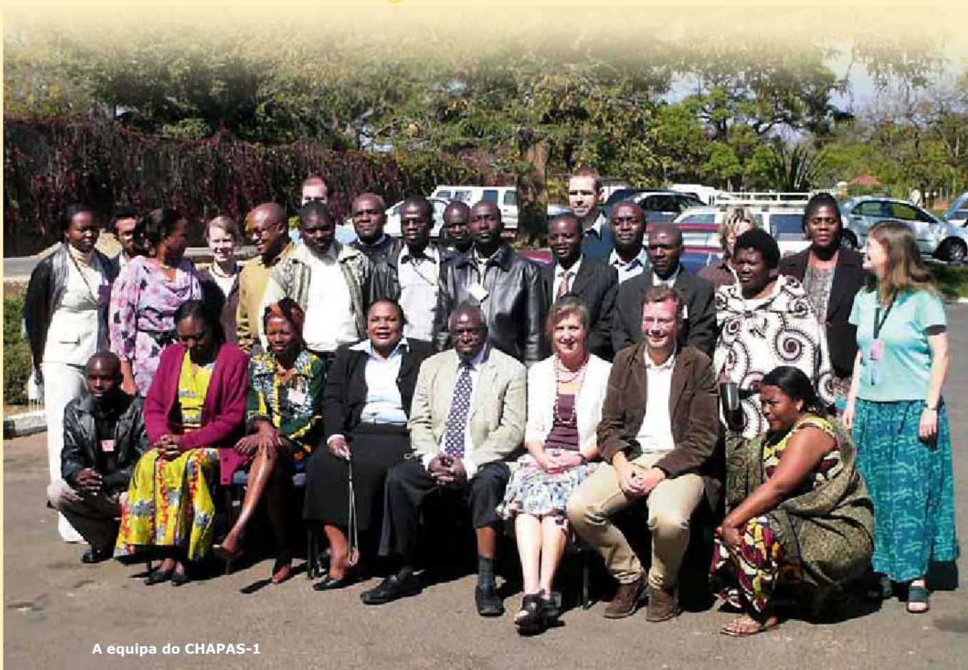
A equipa do CHAPAS-1

Mais informações em: aceda ao perfil do projecto em "Crianças com VIH em África, Farmacocinética e Aderência a Regimes Antiretrovirais Simples" no site da EDCTP em www.edctp.org .