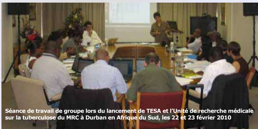
Séance de travail de groupe lors du lancement de TESA et l'Unité de recherche médicale sur la tuberculose du MRC à Durban en Afrique du Sud, les 22 et 23 février 2010

TESA est coordonné par le Dr Alexander Pym et rassemble des organismes africains situés au Malawi, au Mozambique, en Afrique du Sud, en Zambie et au Zimbabwe, en collaboration avec des organismes européens en France, en Allemagne, aux Pays-Bas et au Royaume-Uni.