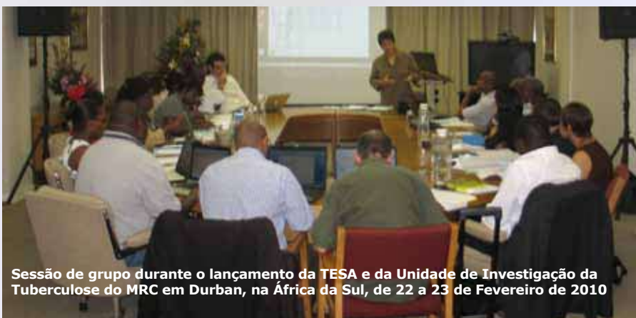
Sessão de grupo durante o lançamento da TESA e da Unidade de Investigação da Tuberculose do MRC em Durban, na África da Sul, de 22 a 23 de Fevereiro de 2010