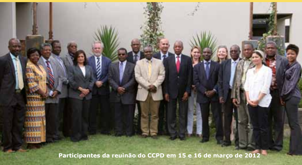
Participantes da reunião do CCPD em 15 e 16 de março de 2012

O CCPD produziu um projeto de estratégia dirigido a estes compromissos. O plano de trabalho para 2012 também prevê a participação da CCPD em visitas do Secretariado aos locais dos projetos financiados pela EDCTP.