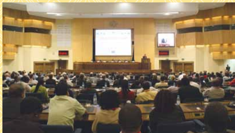
Cérémonie officielle d'ouverture du Sixième forum de l'EDCTP, le 9 octobre 2011 à Addis Abeba en Éthiopie

Un résumé des résultats du Sixième forum de l'EDCTP sera publié en janvier 2012. Pour plus d'informations et pour consulter un récapitulatif des sessions, veuillez consulter le blog du Sixième forum : www.edctpforum.org/sixthforumblog . Les présentations sont téléchargeables depuis le site www.edctpforum.org .