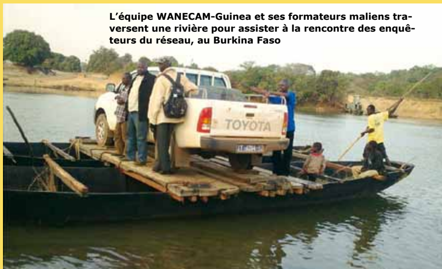
L'équipe WANECAM-Guinea et ses formateurs maliens traversent une rivière pour assister à la rencontre des enquêteurs du réseau, au Burkina Faso

On s'attend à ce que ces études génèrent des données importantes sur la sécurité et l'efficacité de l'utilisation répétitive des deux nouveaux ACT à l'étude (la pyronaridine-artésunate et la dihydroartémisinine-pipéraquline); ceci permettra de mieux évaluer leur valeur ajoutée par rapport aux ACT actuellement sur le marché. Le traitement DHAPQ a récemment été ajouté à la liste des ACT recommandés par l'OMS. Il devrait être rejoint prochainement par la pyronaridine-artésunate.