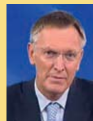
Le Dr Janez Potočnik, Commissaire européen pour la science et la recherche

Lors de la cérémonie d'ouverture, le Dr Janez Potočnik, Commissaire européen pour la science et la recherche, s'est adressé au public dans un message vidéo. Le Commissaire européen a commenté les progrès réalisés au cours des années grâce à la coordination des recherches par l'EDCTP, et il a remarqué, en se référant à l'évaluation indépendante du programme de l'EDCTP menée en 2006: "Étant donné que j'ai toujours cru dans les nobles intentions de cette initiative, j'ai décidé de continuer... Maintenant, près de trois ans après, cela se révèle payant."