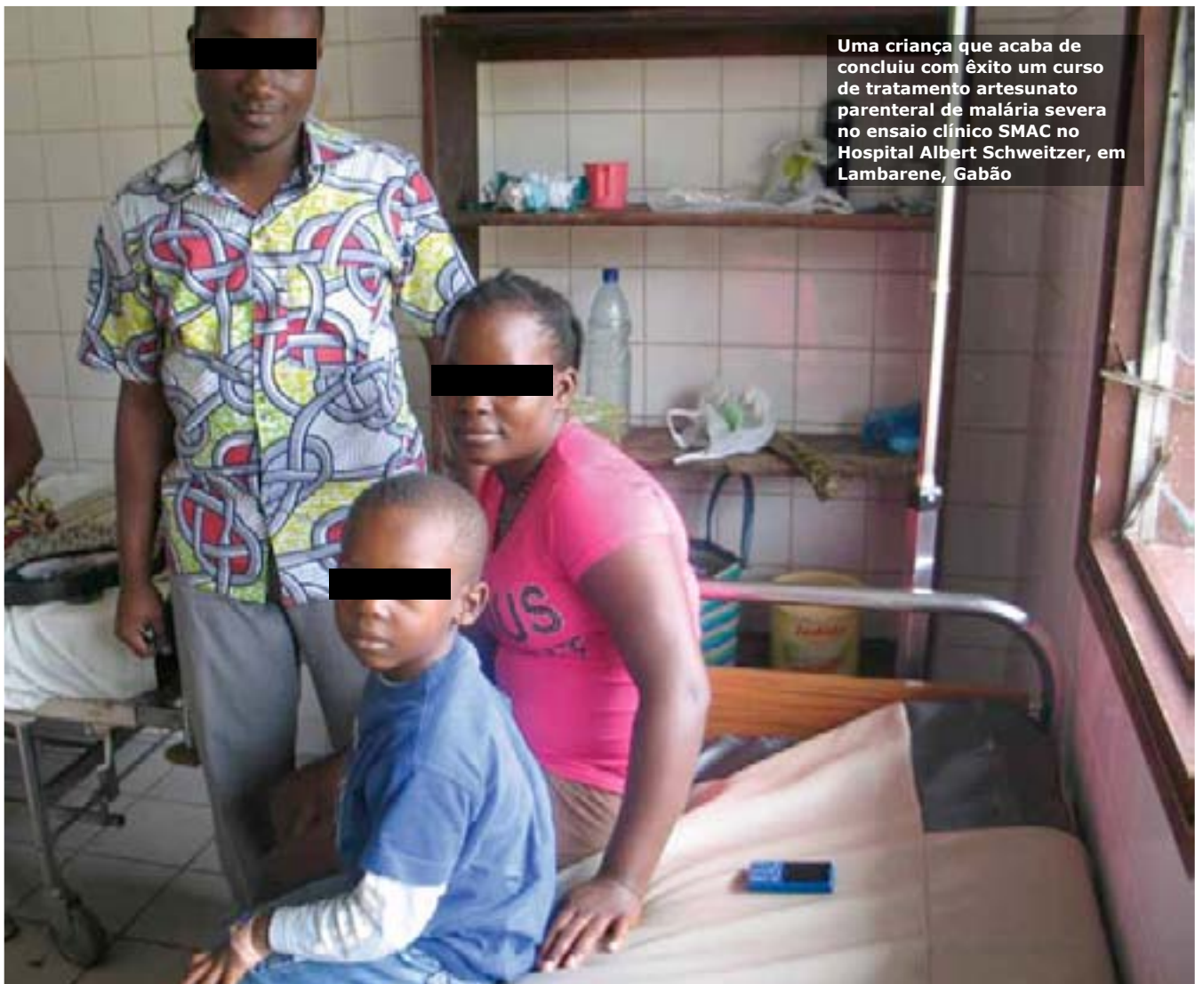
Uma criança que acaba de concluir com êxito um curso de tratamento artesunato parenteral de malária severa no ensaio clínico SMAC no Hospital Albert Schweitzer, em Lambarene, Gabão