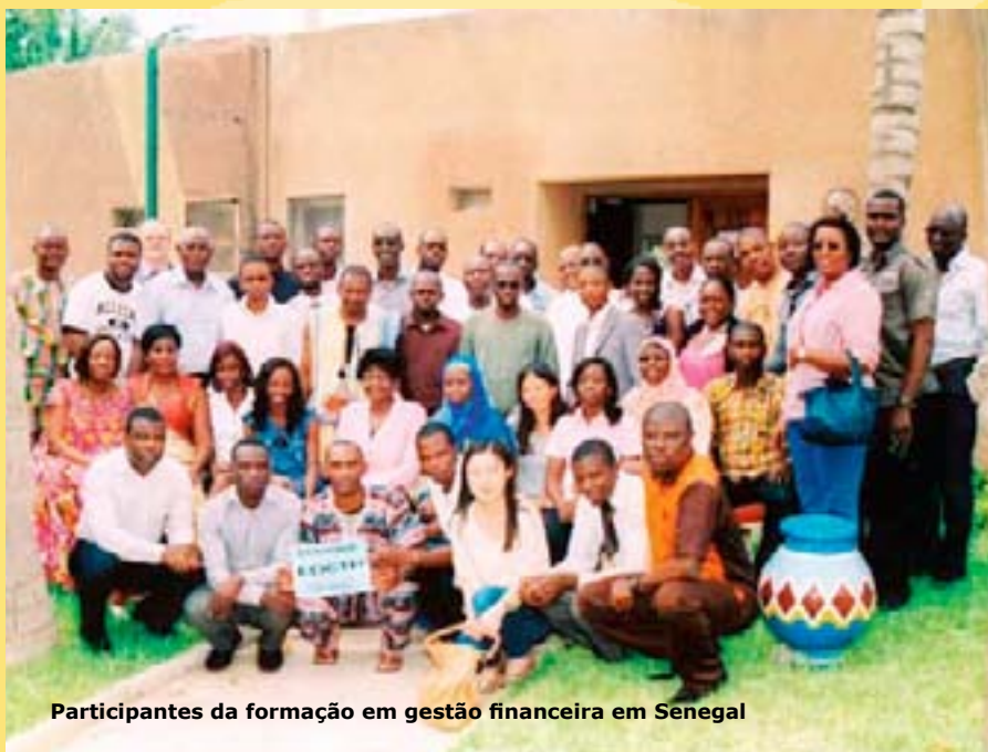
Participantes da formação em gestão financeira em Senegal

A EDCTP organizou em Dacar, no Senegal, de 10 a 15 de setembro de 2012, um seminário sobre gestão financeira dirigido aos funcionários da área das finanças das instituições bolsseiras da EDCTP na África Ocidental e Central. O objetivo do seminário era facultar aos participantes os conhecimentos e as competências necessárias para melhorar a prestação de contas e a transparência financeira nas respetivas instituições.