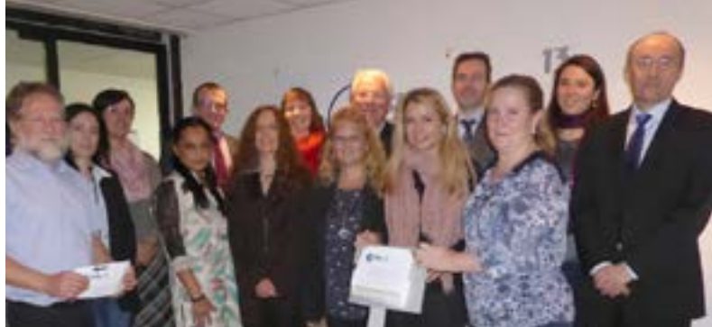
Os parceiros e consultores do Consórcio TRUST na reunião dos parceiros europeus da TRUST em Paris, França

Mais informações sobre convites para apresentação de propostas encontram-se disponíveis em www.edctp.org .