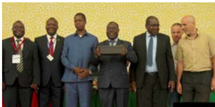
Sua Excelência, o Presidente da República da Zâmbia, Edgar Chagwa Lungu, e os representantes do UNZA-UCLMS pelo programa de Formação e Investigação na cerimónia de premiação